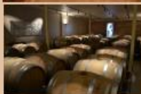
【写真はイメージです】