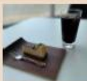
【新メニュー】 チーズケーキ