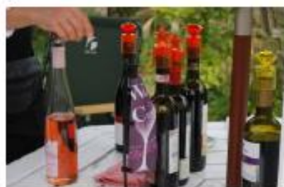
【写真はイメージです】

今から1万年ほど前、黒海とカスピ海に挟 まれた地域でワインは発祥したと考えられ ています。その後、葡萄の栽培方法やワイ ンの醸造方法は世界に伝播し、各地で種々 なワインが作られました。今回のフェスタ でも、シルクロードのワインをテイステイ ング(無料/ドライバーの方は不可)してお 楽しみ頂ける企画を用意します。特徴あるワ インを飲み比べ、文化の違いを感じて下さ い。