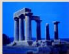
平山郁夫/コリントの遺跡/1978年

日本画家、平山郁夫（1930～2009）は、シルクロードの画家、仏教伝来の画家として広く知られていますが、イタリアやギリシャ、トルコなど地中海周辺地域へも、たびたび訪れ、古代の遺跡や風景の絵などを数多く残しています。本展は、この秋、山梨県立美術館で開催される「デルマ工展 お風呂でつながる古代ローマと日本」の関連企画として、ギリシャ、ローマに関連する美術品と、平山郁夫が描く古代地中海の遺跡をテーマとした作品をご紹介します。当館のある北杜市にもなじみの深い「温泉」や「ワイン」など、共通する文化も多い古代地中海世界の豊かな魅力を楽しんでいただければと思います。